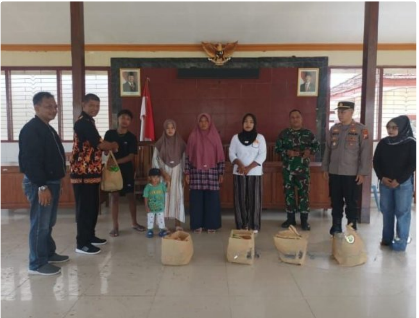
Aksi Peduli TNI - Polri, Danramil 0804/08 Barat Bersama Forkopimca Bersihkan Reruntuhan Pasca Angin Kencang

Magetan - Pasca musibah cuaca ekstrem yang terjadi beberapa waktu lalu yang melanda Wilayah Kecamatan Kartoharjo membuat beberapa rumah mengalami