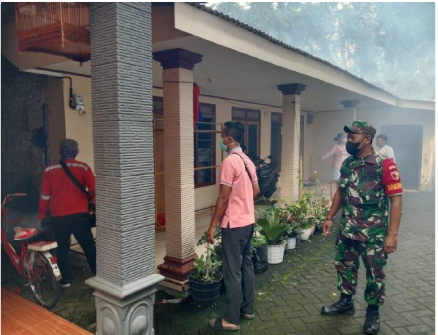
Babinsa Bersama Dinkes Dampingi Fogging, Cegah DBD di Wilayah Desa Binaan