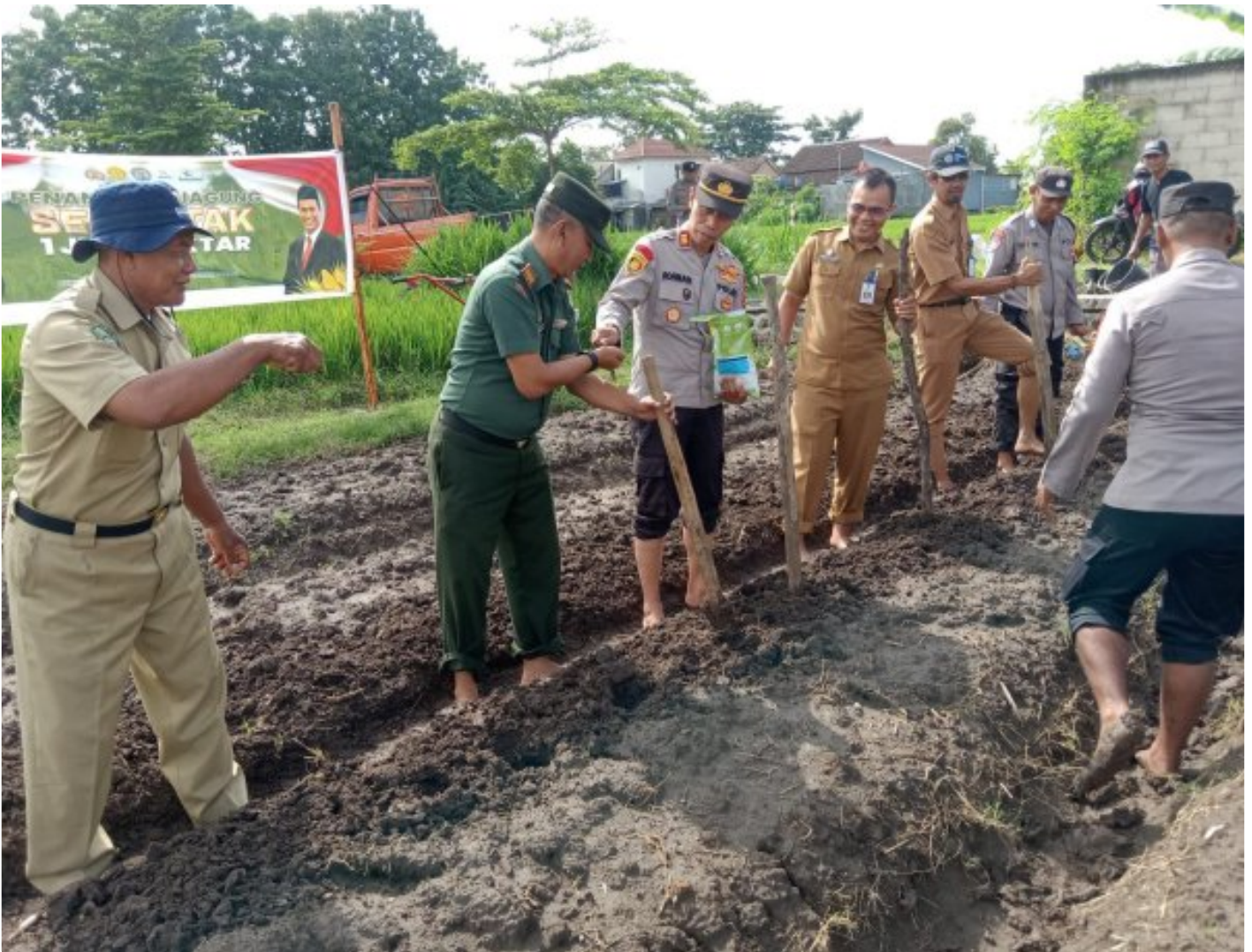
Bersinergi Danramil 0804/11 Takeran Bersama Kapolsek Dalam Kegiatan Penanaman Jagung

Magetan. Forkopimca bersama Anggota dan Dinas Pertanian melakukan penanaman benih jagung dilahan aset Polres Magetan. Bertempat di Dukuh