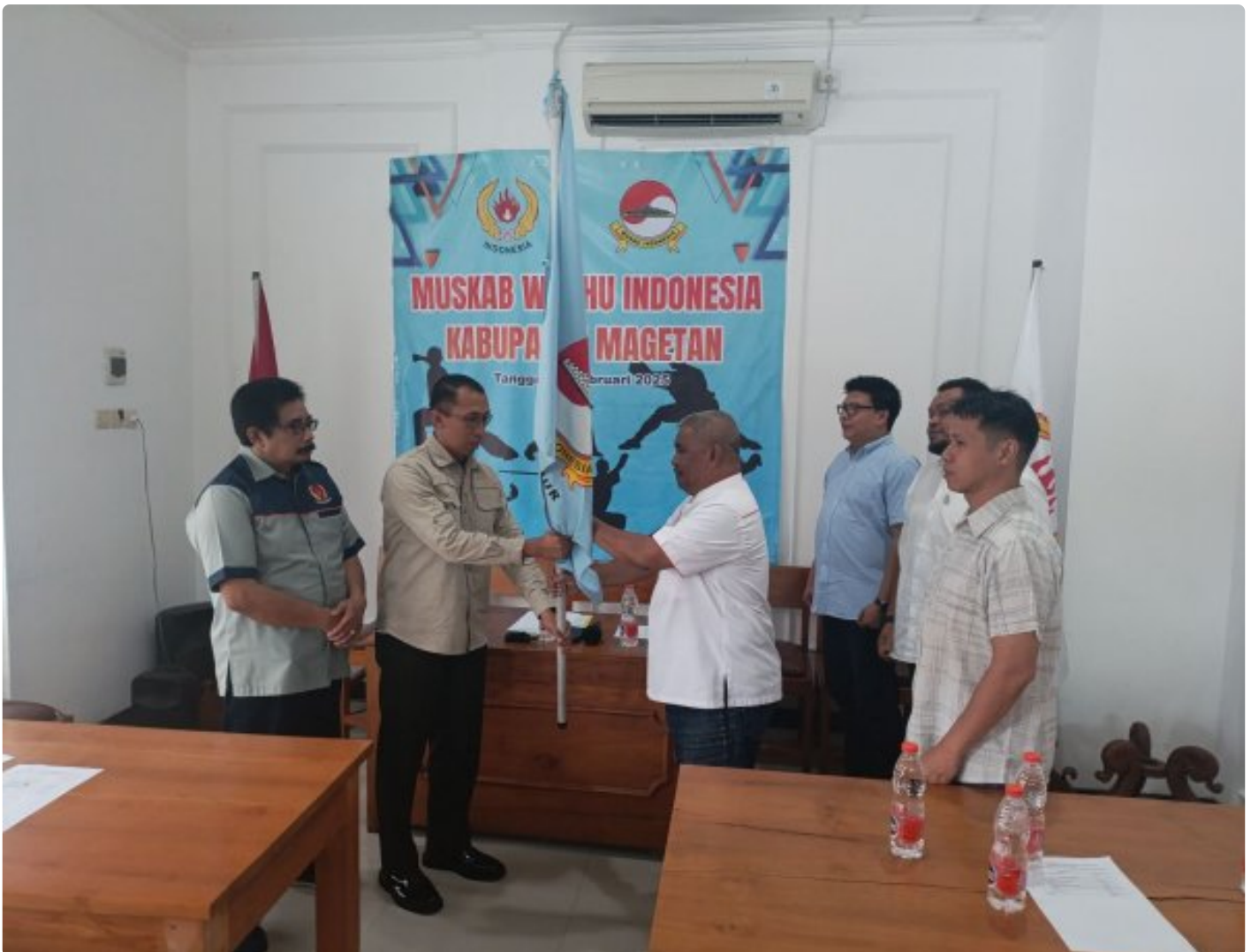
Dandim 0804/Magetan Hadiri acara Musyawarah Wushu Indonesia Kabupaten Magetan Tahun 2025