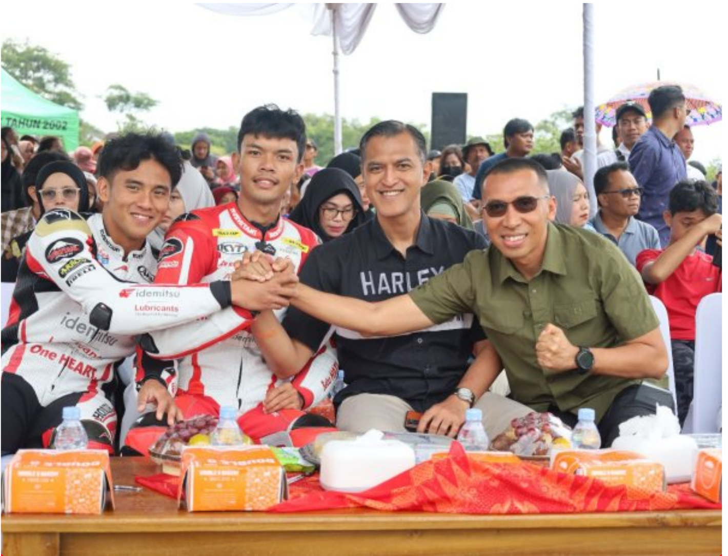
Dandim 0804/Magetan Hadiri Undangan Tinjau Sirkuit Magetan