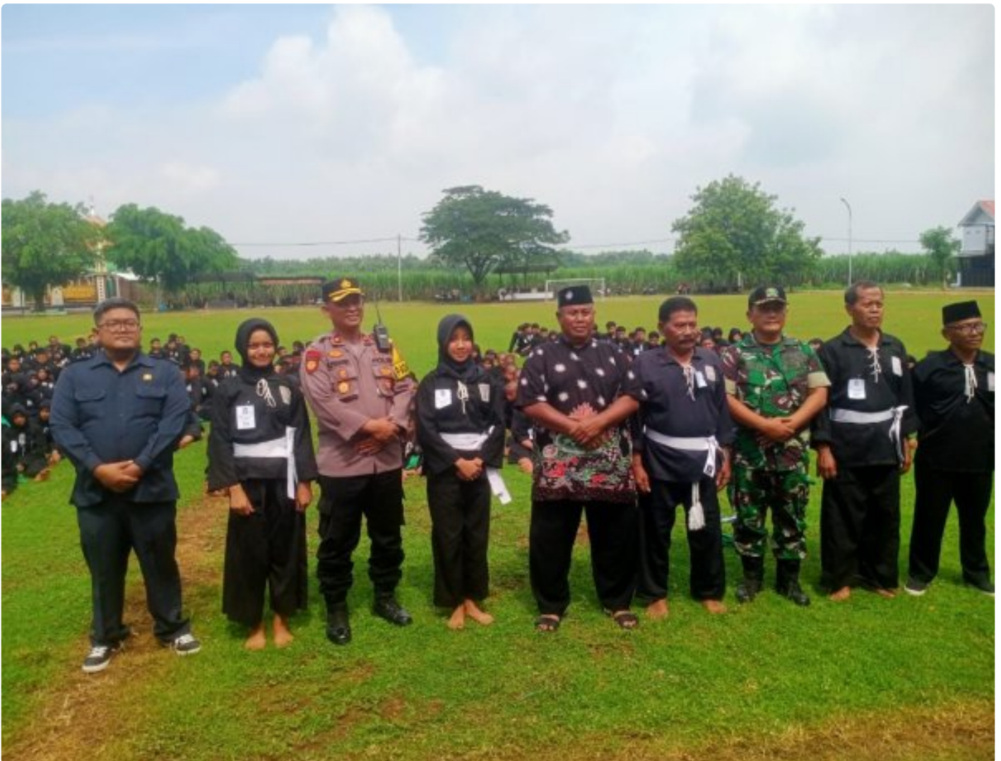
Danramil 0804/06 Maospati Hadiri Tes Kenaikan Tingkat Siswa PSHT Ranting Maospati

Magetan. - Salah satu tahapan yang harus diikuti oleh setiap siswa Persaudaraan Setia Hati Terate (PSHT) sebelum menjadi anggota atau warga