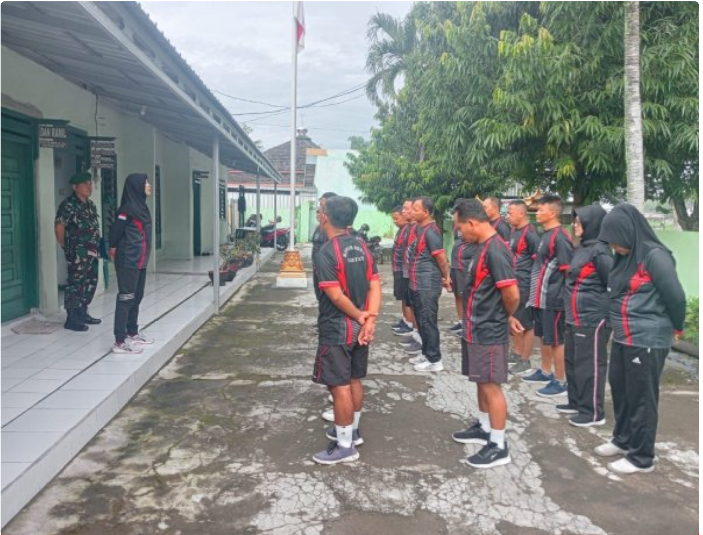
Jaga Kebugaran Tubuh Danramil 0804/06 Maospati Bersama Anggota Lakukan Pembinaan Fisik